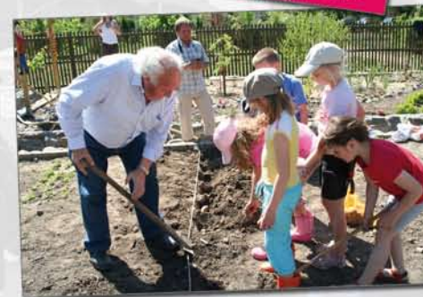
„... im Generationengarten“ - einer der Wettbewerbsbeiträge.